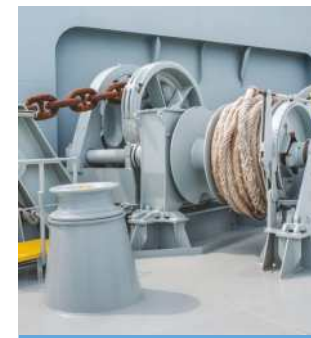
TREUILS DE LEVAGE / GUIDE-CÂBLES