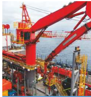
GRUES DE PLATE-FORME PÉTROLIÈRE ET POULIES DE FORAGE