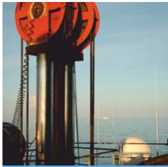
CONDUITES PROLONGATRICES ET TENDEURS