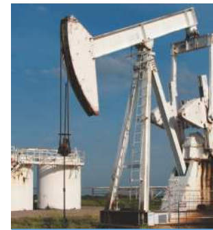
CHEVALETS DE POMPAGE