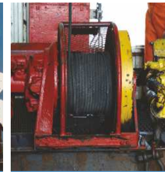
TREUILS DE FORAGE