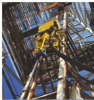
APPAREILS DE FORAGE À ENTRAÎNEMENT PAR LE HAUT