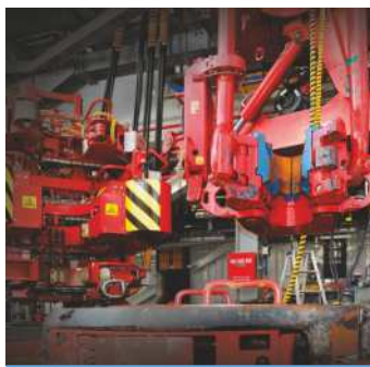
CYLINDRES DE VÉRINS HYDRAULIQUES